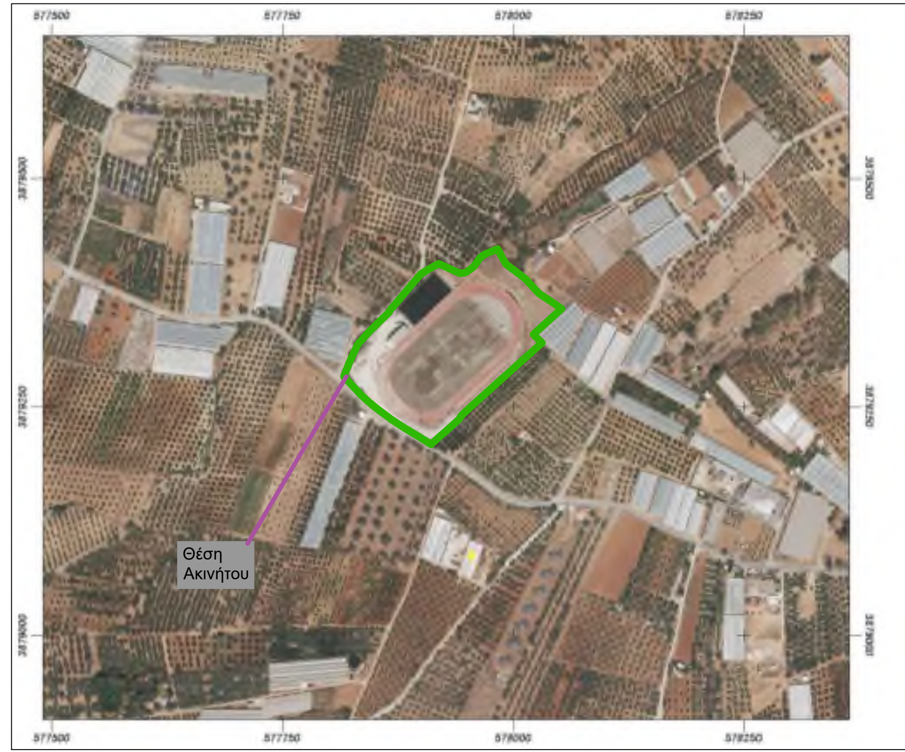
Απόσπασμα ορθοφωτοχάρτη με τη θέση του ακινήτου, Κτηματολόγιο ΑΕ